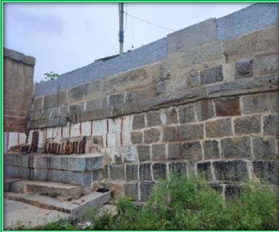
ಕೋಟೆಗೋಡೆಗೆ ತಗ್ಗಿಕೊಂಡಿರುವ ನಾಗರ ಶಿಲ್ಪ