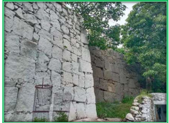
ಪೂರ್ವಕ್ಕೆ ಇರುವ ಕೋಟೆಗೋಡೆ