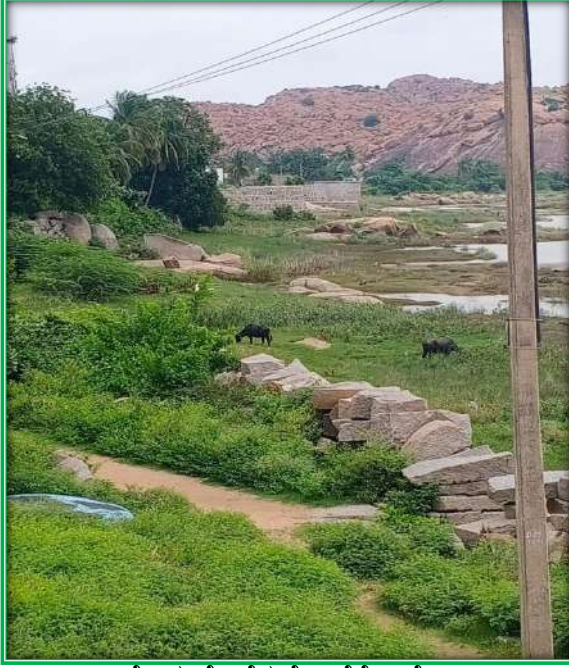
ಬೆಟ್ಟದ ಮೇಲಿನ ಕೋಟೆಗೋಡೆ