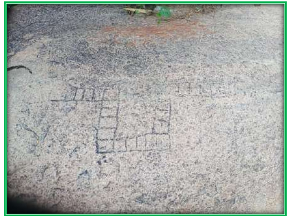
ಬಂಡೆಗಲ್ಲಿನ ಮೇಲೆ ಕೊರೆದಿರುವ ಆನೆಗೊಂದಿ ಕೋಟೆ