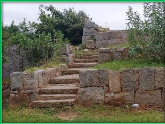
ಪ್ರವೇಶದ್ವಾರದ ಪಕ್ಕದಲ್ಲಿರುವ ಮೆಟ್ಟಿಲುಗಳು